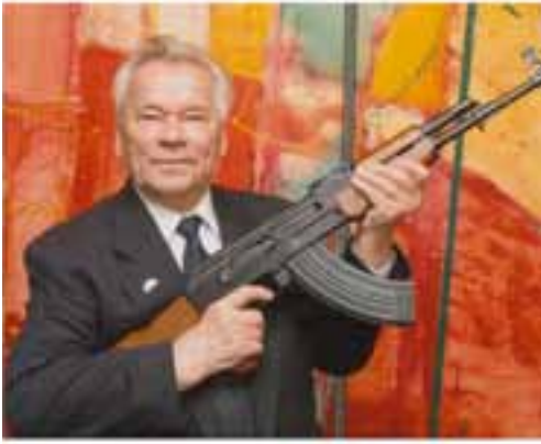
Mihail Timofeyeviç Kalaşnikov (10 Kasım 1919–23 Aralık 2013)

Dünyanın neresinde bir devrimci savaş varsa, orada ilk karşılaşıcağımız görüntü Kalaşnikov olmaktadır. Kalaşnikov'un görüntüleri sadece devrim mücadelelerinde görülmez. O, her türden gerici hareketlere karşı yürütülen mücadelelerde de kendisini gösterir.