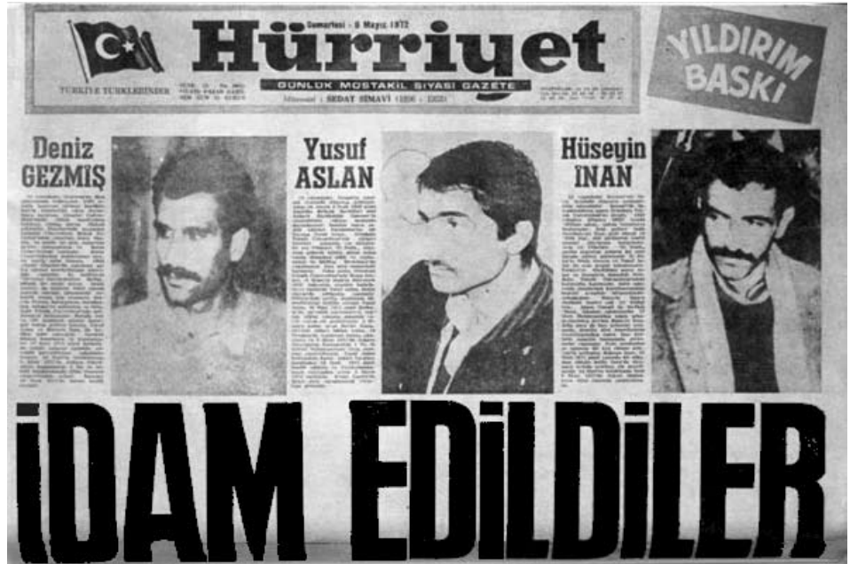
DENİZ GEZMİŞ YUSUF ASLAN HÜSEYİN İNAN 6 Mayıs 1972 / Ankara