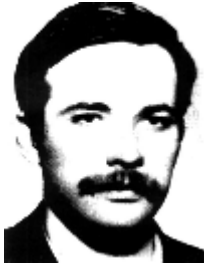
MAHİR ÇAYAN 1946 Samsun